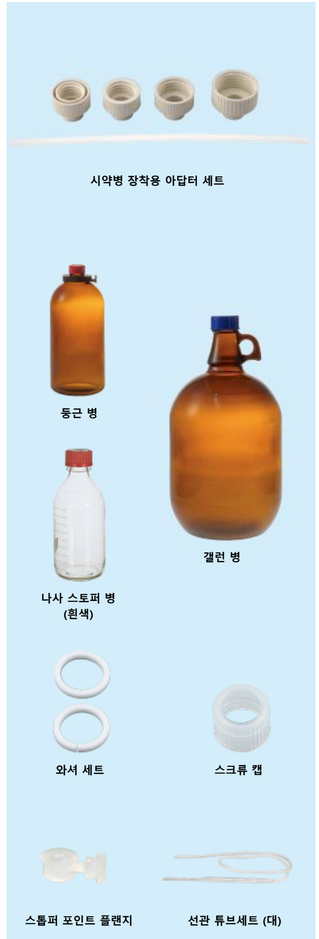
시약병 장착용 아답터 세트